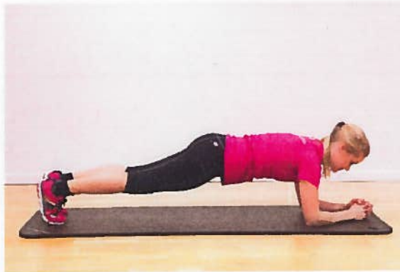
Almindelig planke 60 sek.