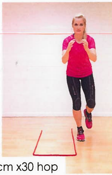
Ankel snor 40 cm x30 hop