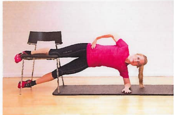
Lyske stol ved knæ x10