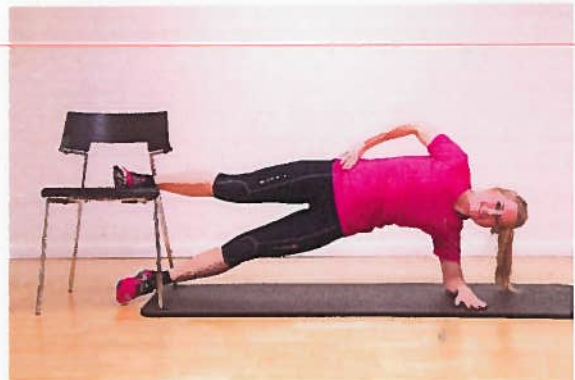
Lyske stol ved ankel x10