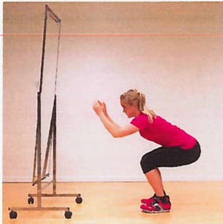
Fri squat x10