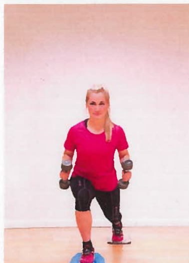
UE align. Tæppeflise bagud + pude + vægt x10