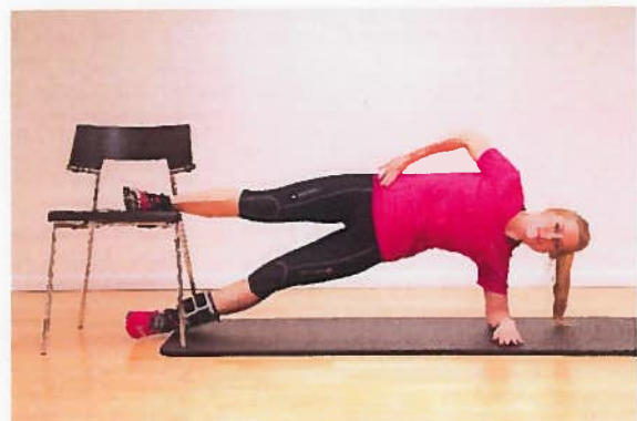
Lyske stol ved ankel + vægt x10