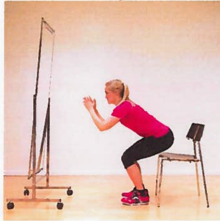
Squat stol x10