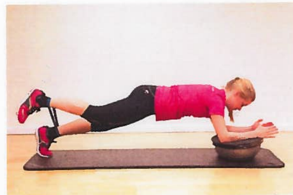
Planke på skildpadde med elastik 2x10