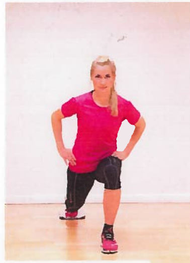
UE align. Tæppeflise bagud x10