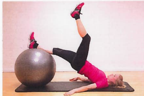
Hase rul 1 ben x15