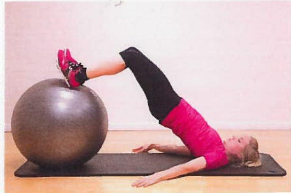
Hase 90 grader x15