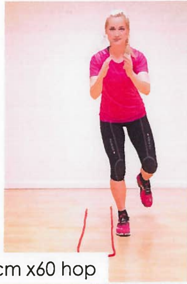
Ankel snor 20 cm x60 hop