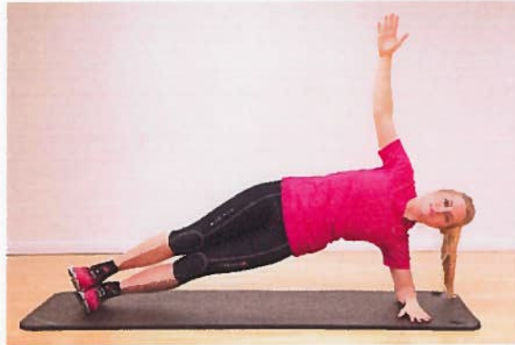
Almindelig sideplanke 30 sek.