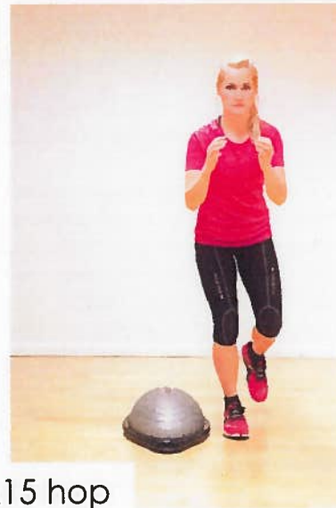
Hop hen over skildpadde x15 hop