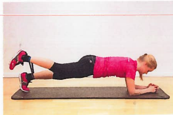
Planke med elastik 2x10