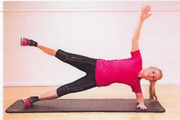
Sideplanke med benløft 30 sek.