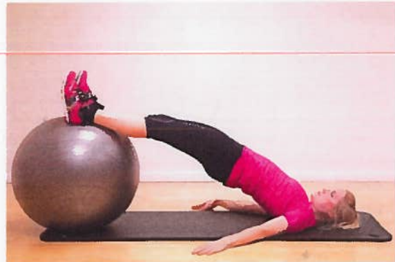
Hase rul x15